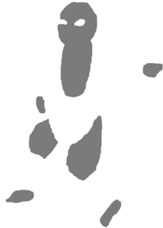
3 胴体・手・足 (型抜き)