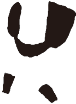
2 衣装と脚絆 (型抜き)