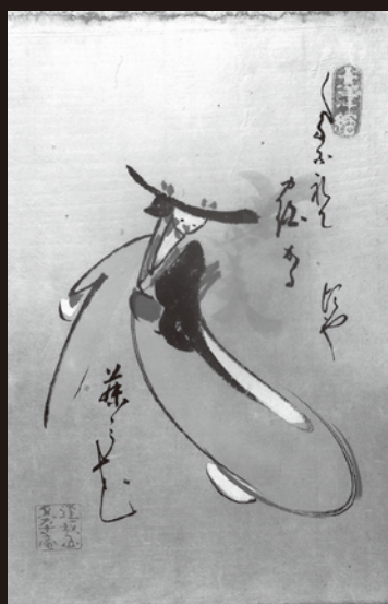
4 2代高橋松山大津絵藤娘