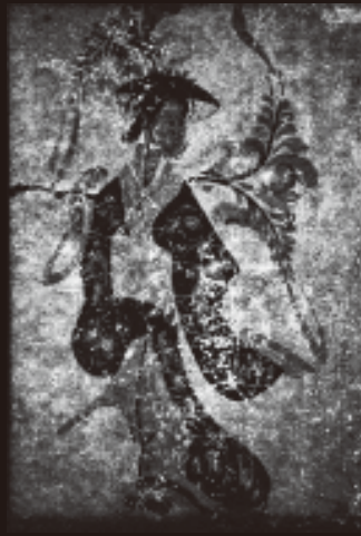
2 藤娘裏面バックライト