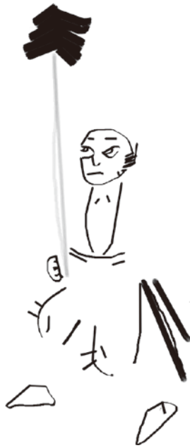
5 輪郭線 (筆書き)