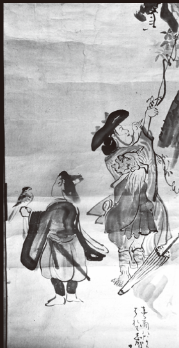
2 大津絵二次製作品